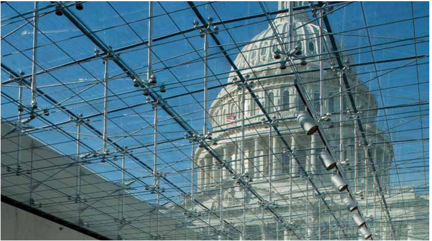
Les verrières majestueuses du Hall de l'Émancipation donnent aux visiteurs une vue spectaculaire du dôme du Capitole et permettent à la lumière du jour d'illuminer l'intérieur.