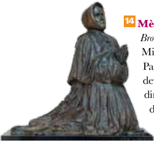
14 Mère Joseph (1823–1902) Washington, Bronze de Felix W. de Weldon, 1980.

Missionnaire et architecte. Née Esther Pariseau près de Montréal, au Canada, devenue religieuse catholique à 20 ans. A dirigé des missions de son ordre religieux dans les Territoires du Nord-Ouest des États-Unis, y compris dans ce qui deviendrait l'État de Washington.