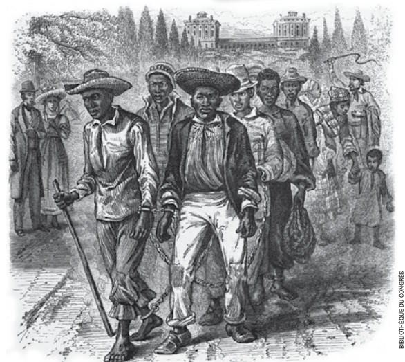
BIBLIOTHÈQUE DU CONGRÈS