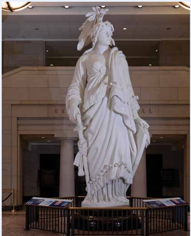
Le modèle en plâtre de la statue de la Liberté se trouve bien en vue du côté ouest du Hall de l'Émancipation.