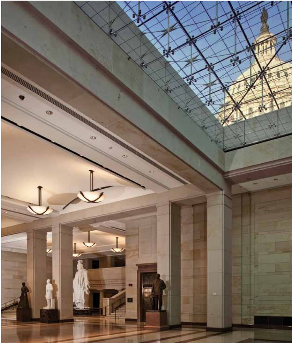
Le Hall de l'Émancipation, au cœur du Centre d'accueil des visiteurs, a été nommé par le Congrès en reconnaissance des ouvriers et des artisans asservis qui ont aidé à construire le Capitole.