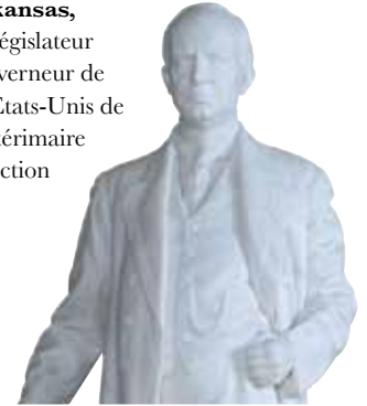
18 James P. Clarke (1854–1916) Arkansas, Marbre de Pompeo Coppini, 1921. Juriste, législateur de l'Arkansas, procureur général et gouverneur de l'Arkansas, puis membre du Sénat des États-Unis de 1903 à 1916. Élu deux fois président intérimaire du Sénat. A appuyé le projet de construction du canal de Panama et l'indépendance des Philippines. Lorsqu'il présidait la commission sénatoriale du commerce, a œuvré en faveur de l'adoption de lois sur la responsabilité patronale et l'indemnisation des victimes d'accidents du travail.