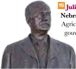
15 Julius Sterling Morton (1832–1902) Nebraska, Bronze de Rudolph Evans, 1937.

Responsable de la conception, de la construction et du financement de onze hôpitaux, sept académies, cinq écoles pour enfants amérindiens et deux orphelinats. Sur le piédestal figurent des instruments de dessin et des images de ses bâtiments.