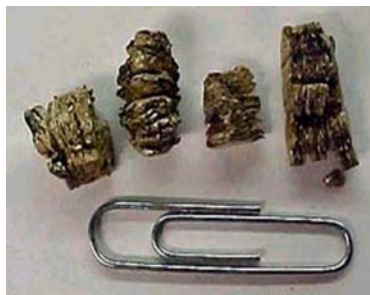
Tamaño de las partículas de vermiculita comparado con un clip de papel clip