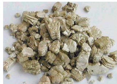
Aislante de vermiculita típica