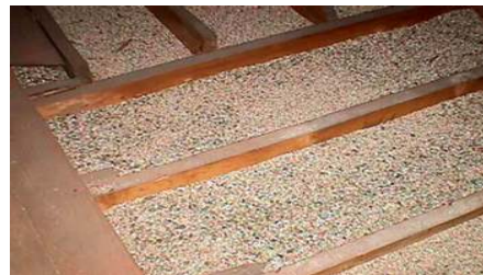
Aislante de vermiculita entre vigas en el ático