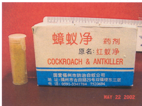
未經註冊的殺蟑螂蟻藥劑