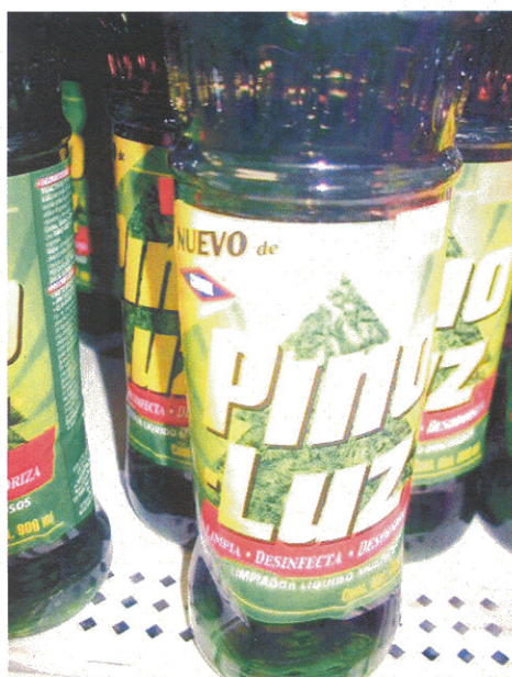
未經註冊的消毒劑