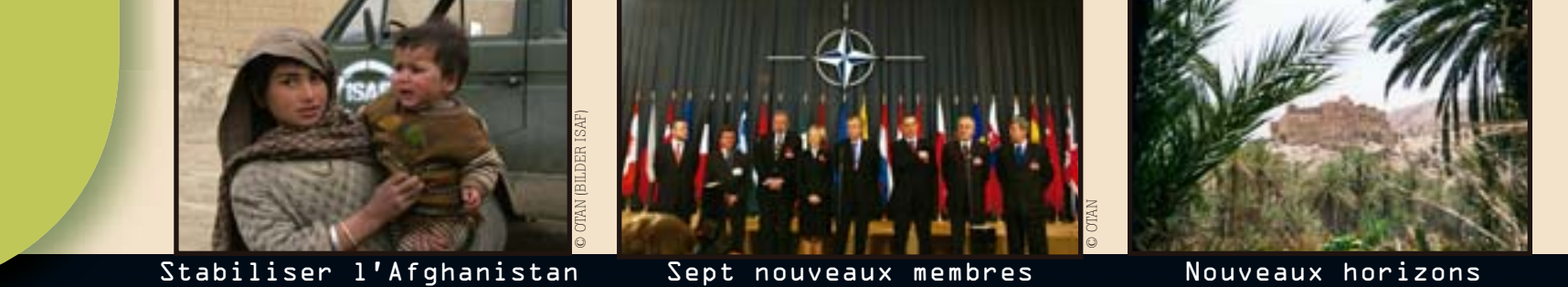
Stabiliser l'Afghanistan Sept nouveaux membres Nouveaux horizons

* La Turquie reconnaît la République de Macédoine sous son nom constitutionnel.