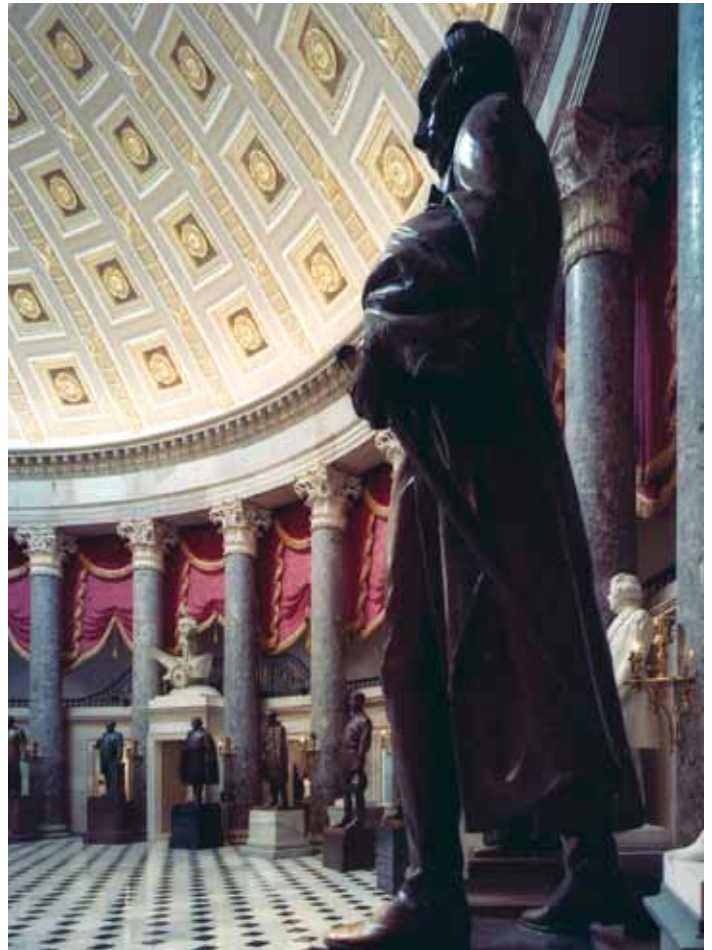
L'Old Hall de la Chambre des représentants est désormais le Hall des statues de la nation

Le bâtiment ajouté le plus récemment est le Centre d'accueil des visiteurs, construit sur trois étages sous l'esplanade est. et terminé en 2008. Il comprend un hall d'exposition, des auditoriums de première orientation, un restaurant, des boutiques, un tunnel le reliant à la Bibliothèque du Congrès et de nombreuses autres commodités pour les visiteurs, ainsi que des améliorations fonctionnelles pour le Capitole.