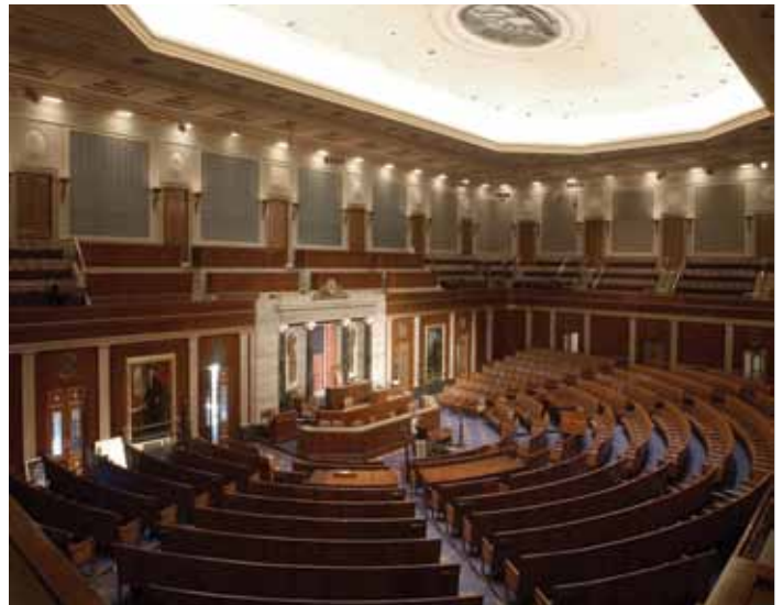
La Chambre des Représentants

La visite du Capitole commence à l'entrée du Centre d'accueil des visiteurs près du croisement de First Street et East Capitol Street où tous les visiteurs doivent subir un contrôle de sécurité.