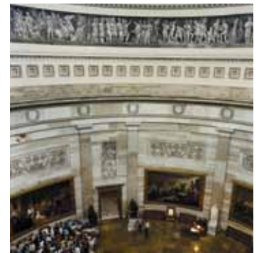
La Rotonde est une étape impressionnante de la visite du Capitole

Le Centre d'accueil des visiteurs est ouvert de 8h30 à 16h30 du lundi au samedi, sauf pour la fête de Thanksgiving, le jour de Noël, le premier janvier et le jour de l'investiture présidentielle.