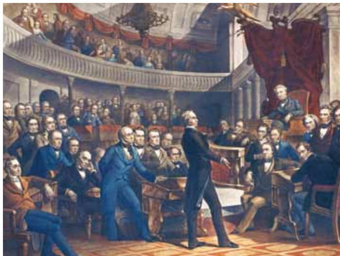
Le sénateur Henry Clay propose le Compromis de 1850 dans l'Old Senate Chamber

En 1819, les ailes reconstruites du Capitole ont été rouvertes. Le bâtiment central, terminé en 1826, reliait les deux ailes. Un dôme peu élevé, en bois et en cuivre, recouvrait la Rotonde.