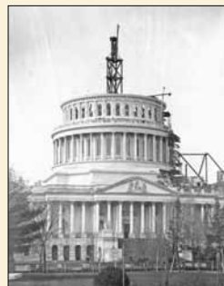
Construction du nouveau dôme en fonte en 1861