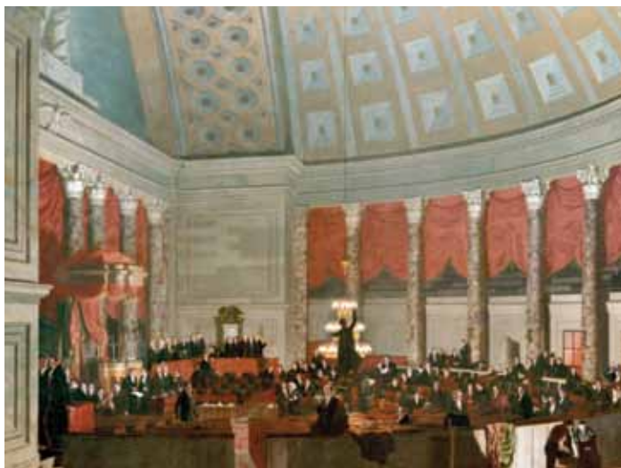
L'Old Hall de la Chambre des représentants, peint par Samuel F.B. Morse, dans la collection de la Corcoran Gallery of Art