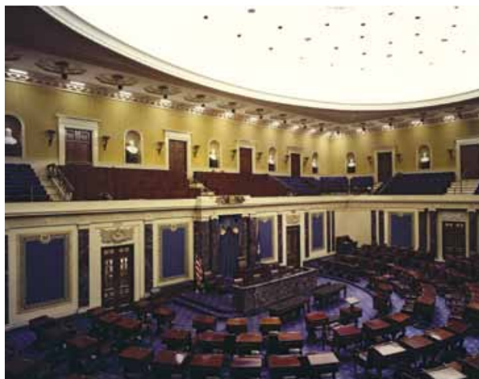
La salle des séances du Sénat

Le Sénat s'est installé dans son hémicycle actuel lorsque la nouvelle aile nord du Capitole a été terminée en 1859. Le président de la séance préside depuis la tribune, au centre. Les étages inférieurs sont attribués aux membres du personnel administratif du Sénat. Cent pupitres sont disposés en demi-cercle et attribués en fonction de l'affiliation à un parti. Sauf en de rares occasions, le public peut assister aux débats et les galeries du Sénat sont ouvertes à la presse, au personnel, aux familles des parlementaires, aux diplomates et aux visiteurs. Les débats quotidiens du Sénat sont télévisés depuis 1986.