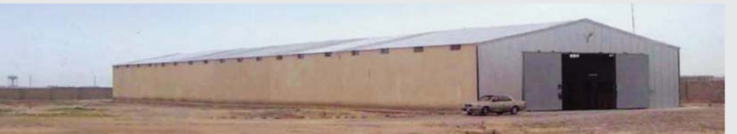
تكريت، مستودع كان جزءا من عقد بقيمة 12 مليون دولار منحه وزارة الدفاع لشركة لي ديناميك الدولية.

أثناء خدمته كعضو كبير في لجنة اختيار المصدر وافق على الحصول على تذكرة سفر ومبلغ 50 ألف دولار أمريكي من مقابل تم إرسال عقد مستودعات بمبلغ 12 مليون دولار على شركته من قبل اللجنة. التهمة: قبول عطايا غير قانونية. الحكم: في انتظار الحكم.