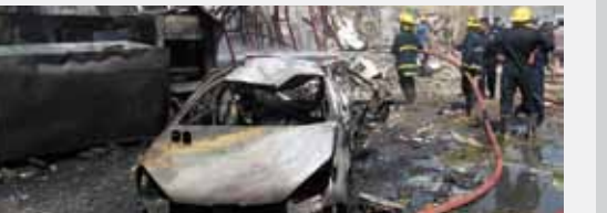
عمل رجال الإنقاذ في موقع تفجير قنبلة في بغداد في 1٦ حزيران/يونيو، ٢٠١٠ .