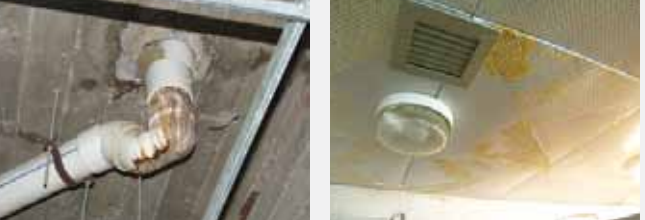
وخلال هذا التفتيش، عثر على دلائل على وجود غش محتمل، وأجملت هذه المسائل لتحقيقات المفتش العام الخاص بإعادة إعمار العراق لاتخاذ الإجراء المناسب، وهذه القضية هي الآن في مرحلة التقاضي.